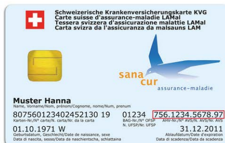
Ex. carte d'assuré

Ensuite, connectez-vous à l'adresse Internet :