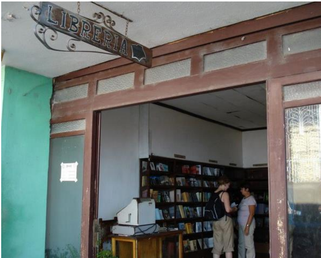
Librairie à Trinidad, Cuba

Document à l'usage des élèves et du corps enseignant de l'EPCL