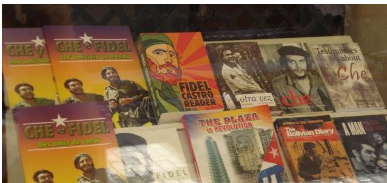
Vitrine d'une librairie à la Havanne, Cuba