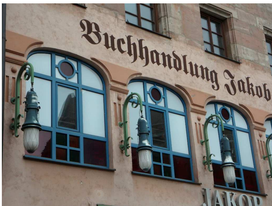
Façade d'une librairie, Nuremberg